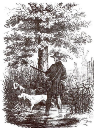
Bild från Bromans bok Kalender för jägare, fiskare och landtmän , 1865.