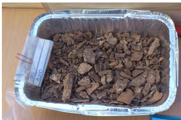
Så mycket blev det kvar av en människa i en brandgrav från folkvandringstiden.