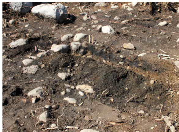
Gravsättning från utgrävningssplatsen

Nedan ses ett par bilder från utgrävningen som är tagna av artikelförfattaren.