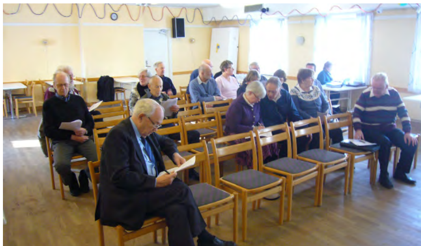
En koncentrerad skara mötesdeltagare studerar årsmöteshandlingarna.